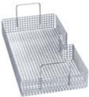
2 x Einsatz AK 12 zur Aufnahme von diversen Utensilien