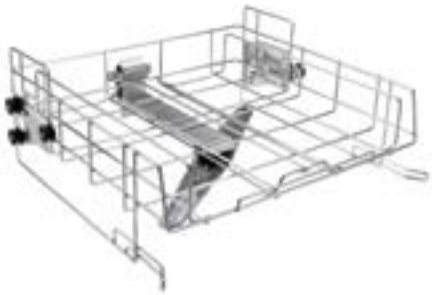
1 x Oberkorb A 101, höhenverstellbar, mit integriertem Sprüharm zur Aufnahme von Einsätzen